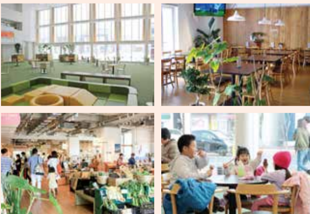
木調の壁が明るくオシャレなフリースペースには喫煙室も併設