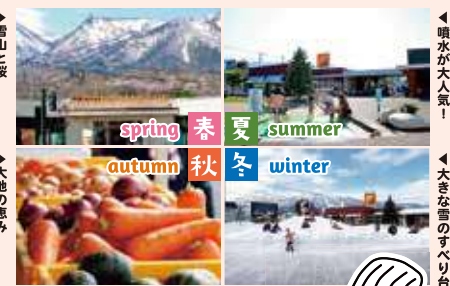
▶雪山と桜 ▶大地の恵み

私たちがめざしているのは通過型の「道の駅」ではなく、富良野ならではの「食文化」を通して、老若男女が楽しく集い交流する「まちの縁側」です。